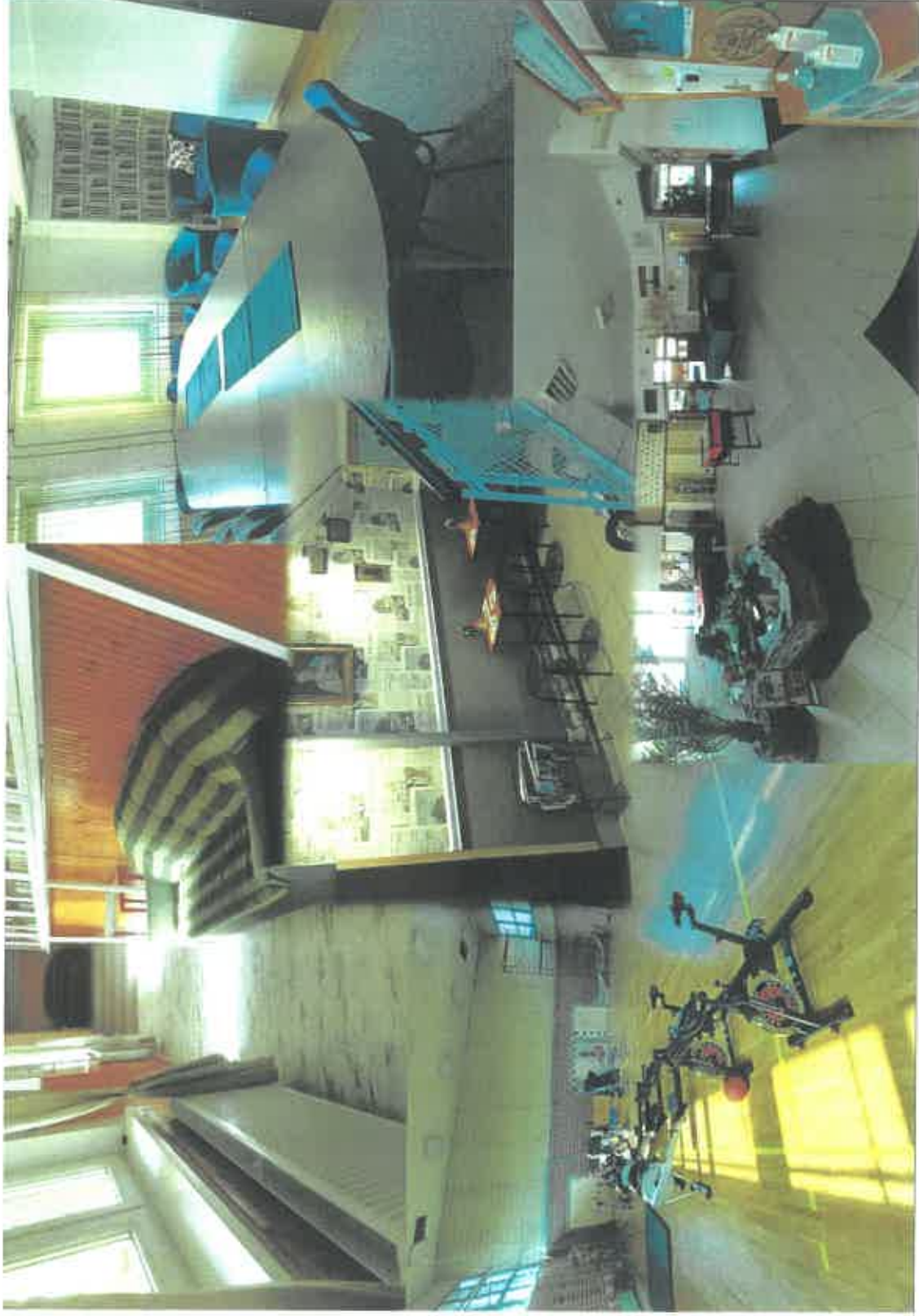
Csabai Róbert pályázata